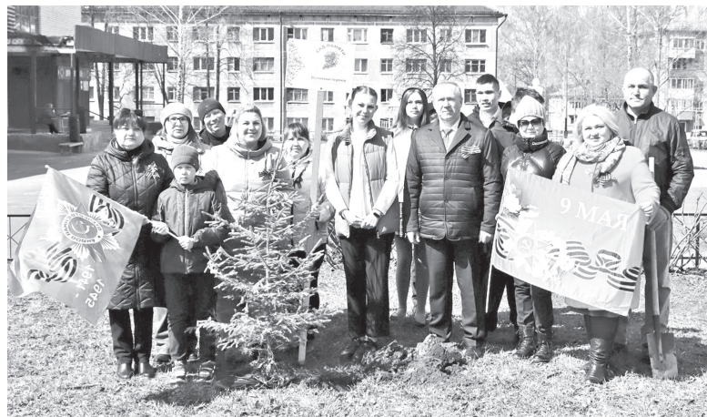
▲ В посёлке Солнечном рядом с главной площадью высадили ели

Жители Советского района активно участвуют в Международной патриотической акции «Сады памяти». По всей стране закладываются новые сады, аллеи, парки и скверы в память о погибших в Великой Отечественной войне—самой жестокой за всю историю. 27 миллионов жизней советских людей унесла война, и ровно столько деревьев—27 миллионов—будет высажено в ходе акции в память о жертвах той войны.