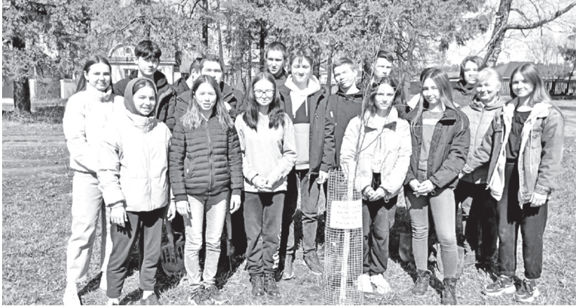
▲ В Алексеевском высадили именные деревья