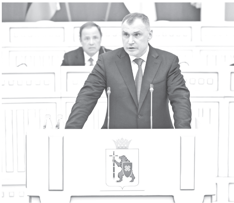
▲ Врио Главы Республики Марий Эл Юрий Зайцев рассказал о приоритетных направлениях в своей работе

Александр Евстифеев в свою очередь подчеркнул, что руководить Республикой Марий Эл для него была большая честь и ответственность, поблагодарил Президента Российской Федерации Владимира Путина, депутатов Государственного Собрания и жителей марийского края за оказан-