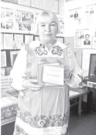
▲ Любовь изажын наградыже-влак дене палдарыш

Мо шарнем, Анатолий изам, школ парт кокла гыч тўгалын, эре тунемын. Ме маленна, а тудо пелїуд марте эре книга пелен шинчен. Институтым тунем лектын, вара Эстонийысе Тарту олашке тунемаш каен. Мўнгтў толеш, кужу корныш тарваныман, авам тудлан пошкудо деч оксам арен пуэн колтен. Мый чўчкыдынак тынар шуко кузе тунеммыж шуын манын шоненам. Кунар шуко тунемын, эшеат утларак уым пален налмыже шуын улмаш. Ушан енгын кидпат чыла тўрлў пашалан толын. Тудо окна рамым, кўвар гыч тувыраш марте шогышо книга шкафым бштен.